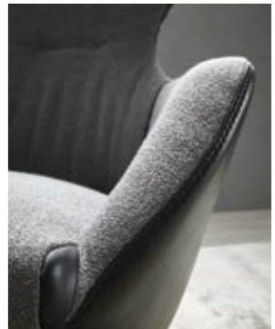
04. Relax Funktionsessel Contur® Gaudino 100 in Stoff, 76% Polyester, 16% Viskose, 8% Leinen, Schale in Leder schwarz, Fußteil und Rücken manuell verstellbar, Dreh-Untergestell schwarz, Sitzhöhe ca. 46 cm, BHT ca. 76x105x86 cm.

Ausführung: Handwerkliche Verarbeitung bis ins Detail, Stoff innen und Leder außen →