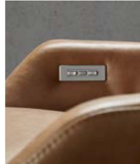
01. Relax Funktionsessel Contur® Gaudino 200 in Leder Bentley cognac Fußteil und Rücken motorisch verstellbar, Dreh-Untergestell Alu gebürstet, Sitzhöhe ca. 46 cm, BHT ca. 76x105x86 cm.

Einfach mal zurücklehnen und relaxen. Mit der Rückenverstellung werden alle Träume wahr.